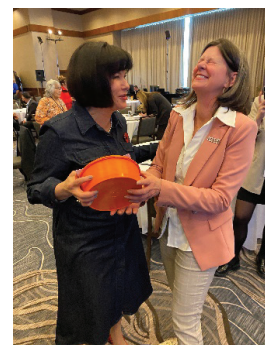
en plein Sommet!