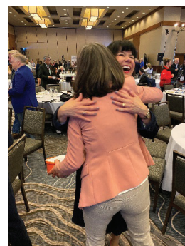
Merci de me le remettre...