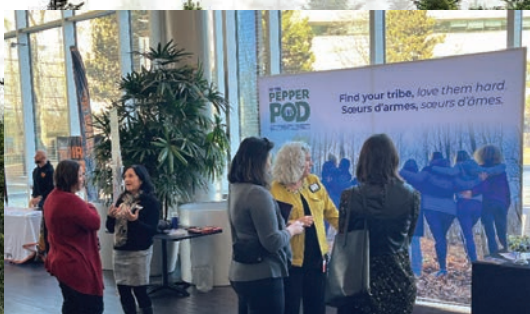
Table ronde Nichola Goddard

La Fondation Les Fleurons glorieux a tenu son événement sur le leadership des femmes en hommage à la capitaine Nichola Goddard au Centre national des Arts, le 19 mars.