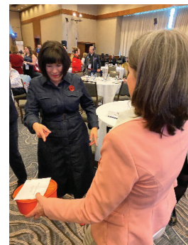
C'est mon Tupperware?